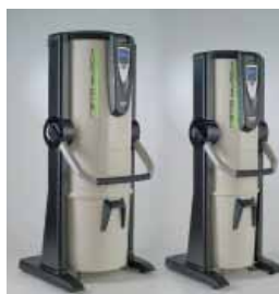
Revo Block Professional