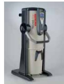
TECNO Star Dual Power